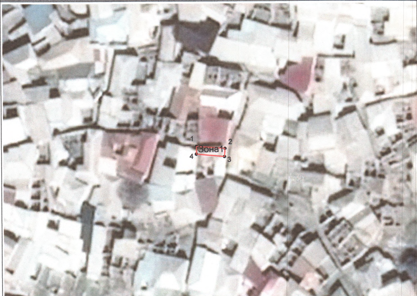
Каталог координат поворотных точек, длин, углов

Карта (схема) границ территории объекта культурного наследия регионального значения «Башня Чинара Мусы», XV-XIX вв. Адрес: Республика Дагестан, Гунибский район, с. Ругуджа, ул. Ругуджинская.