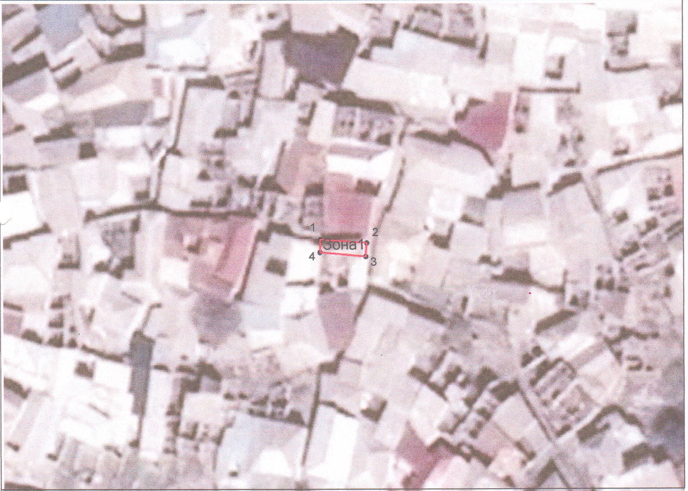
Каталог координат поворотных точек, длин, углов

Карта (схема) границ территории объекта культурного наследия регионального значения «Башня Чинара Мусы», XV-XIX вв. Адрес: Республика Дагестан, Гунибский район, с. Ругуджа, ул. Ругуджинская.