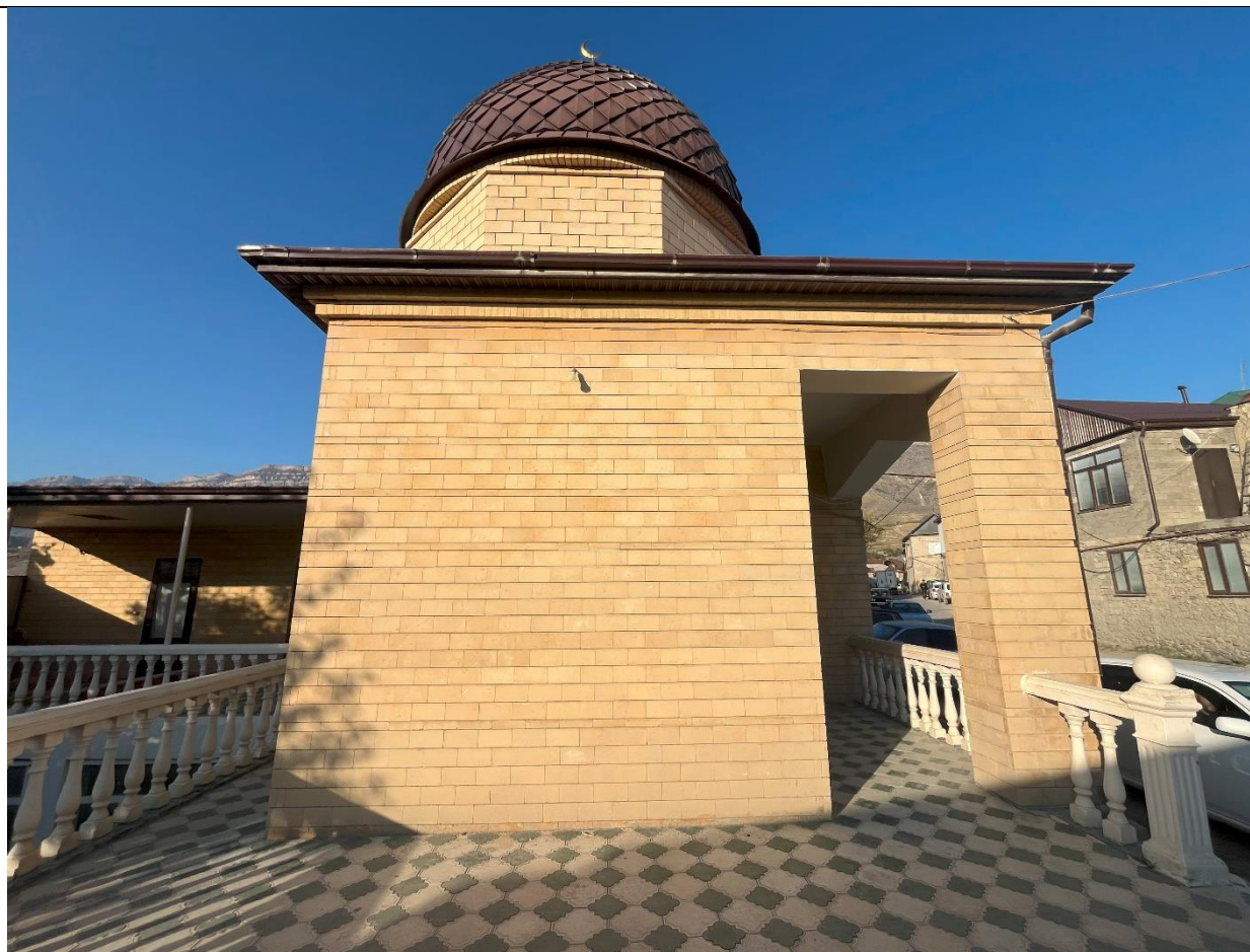
Фото 5. Южная сторона (восточная часть) мечети