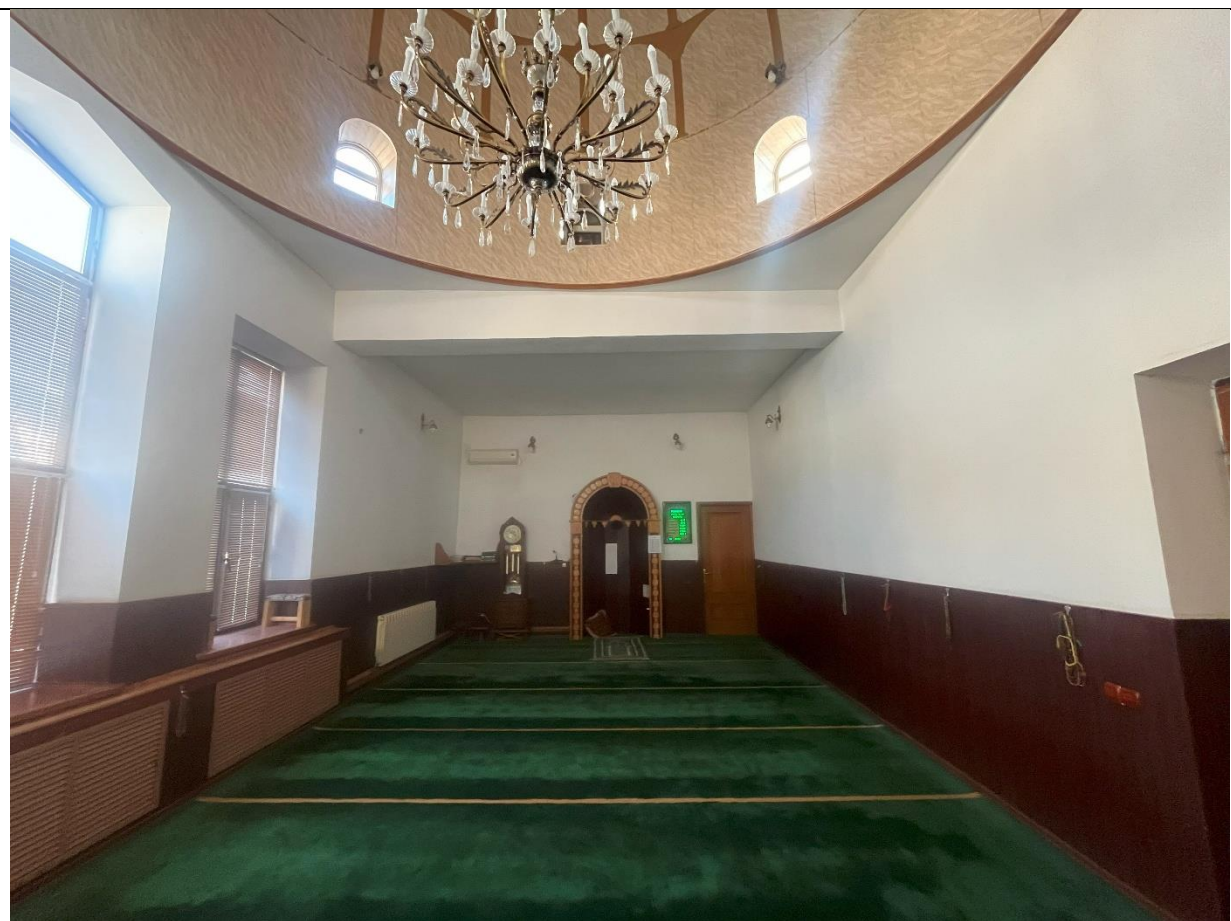
Фото 6. Основной зал мечети. Вид на южную часть