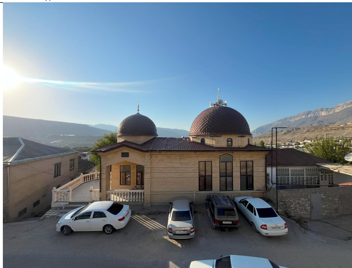
Фото 2. Вид мечети с востока