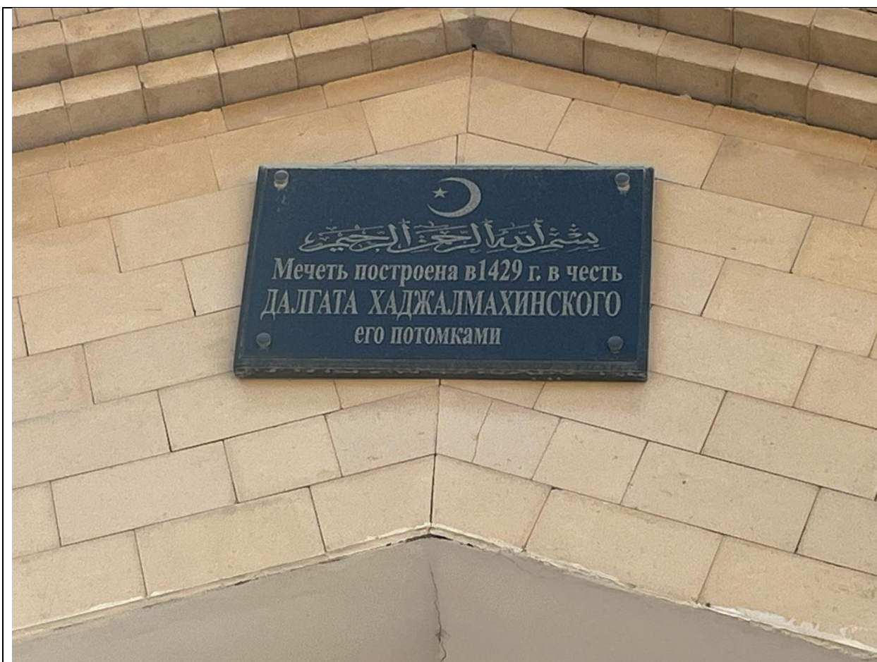
Фото 3. Гранитная плита с надписью на восточной стене мечети