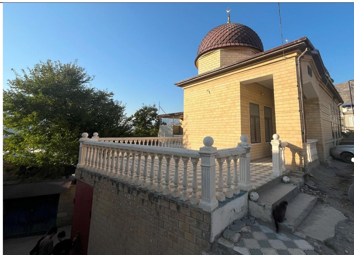
Фото 1. Вид мечети с юго-востока