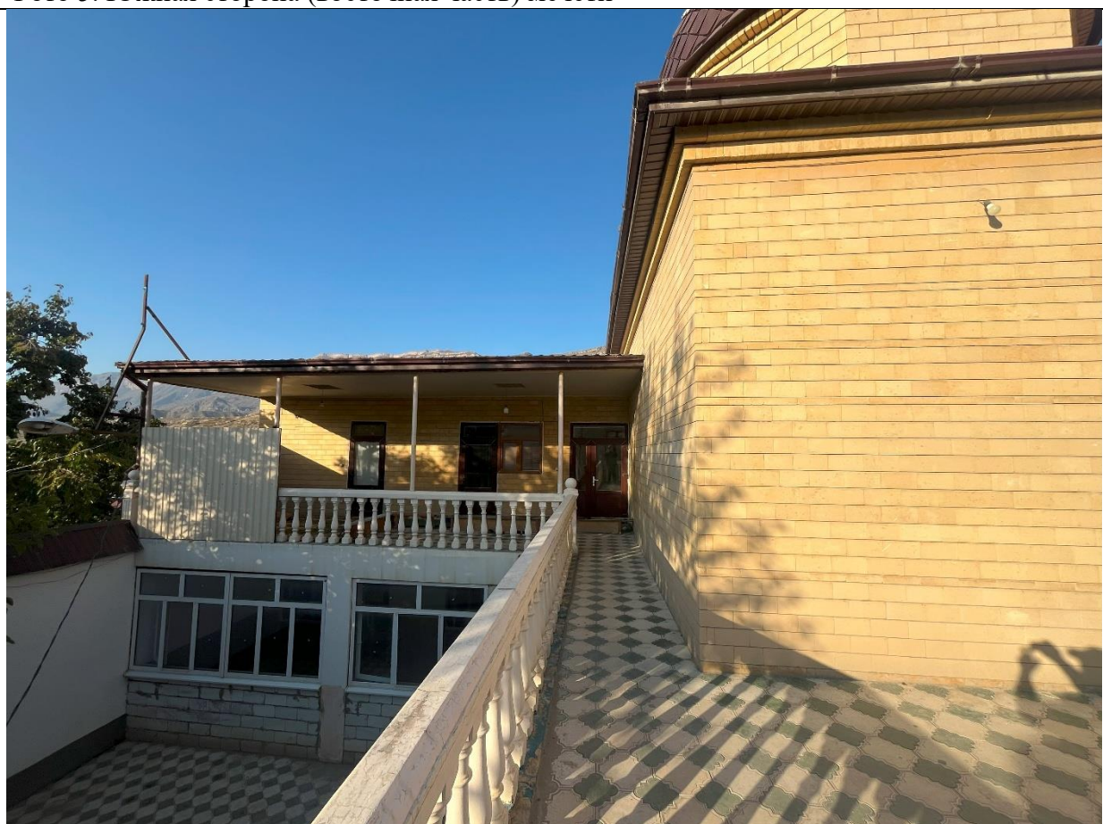
Фото 5. Южная сторона (западная часть) мечети