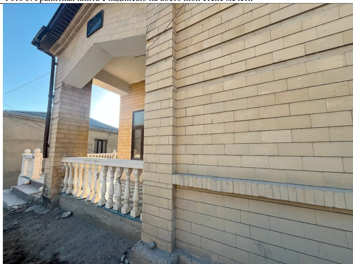
Фото 4. Восточная стена (южная часть) мечети