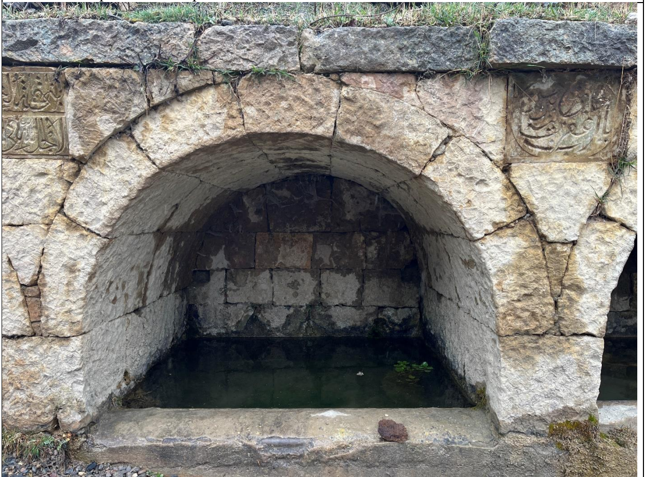
Фото 6. Средний цилиндрический свод источника