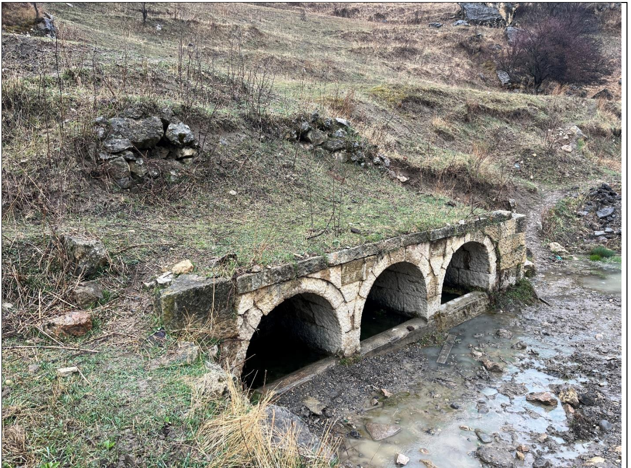
Фото 3. Вид на источник с северо-запада