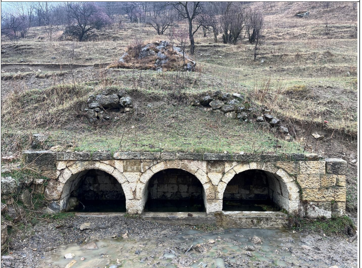
Фото 2. Западная торцевая часть источника