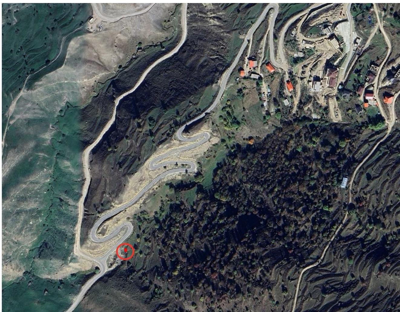
Рис. 1. Красный кругом выделено местоположение исследуемого объекта, который принят на государственную охрану в качестве объекта культурного наследия регионального значения под наименованием «Источник» (Республика Дагестан, Гунибский район, с. Чох, 2 км к югу от села)

На основании изложенного установлено, что исследуемый объект (выявленный объект культурного наследия: «Источник», расположенный по адресу: Республика Дагестан, Гунибский район, с. Чох, в 1,5 км. от сел. Чох) принят на государственную охрану постановлением Правительства Республики Дагестан от 29 марта 2000 г. № 45 «О внесении дополнений в перечень памятников истории и культуры республиканского значения, подлежащих государственной охране».