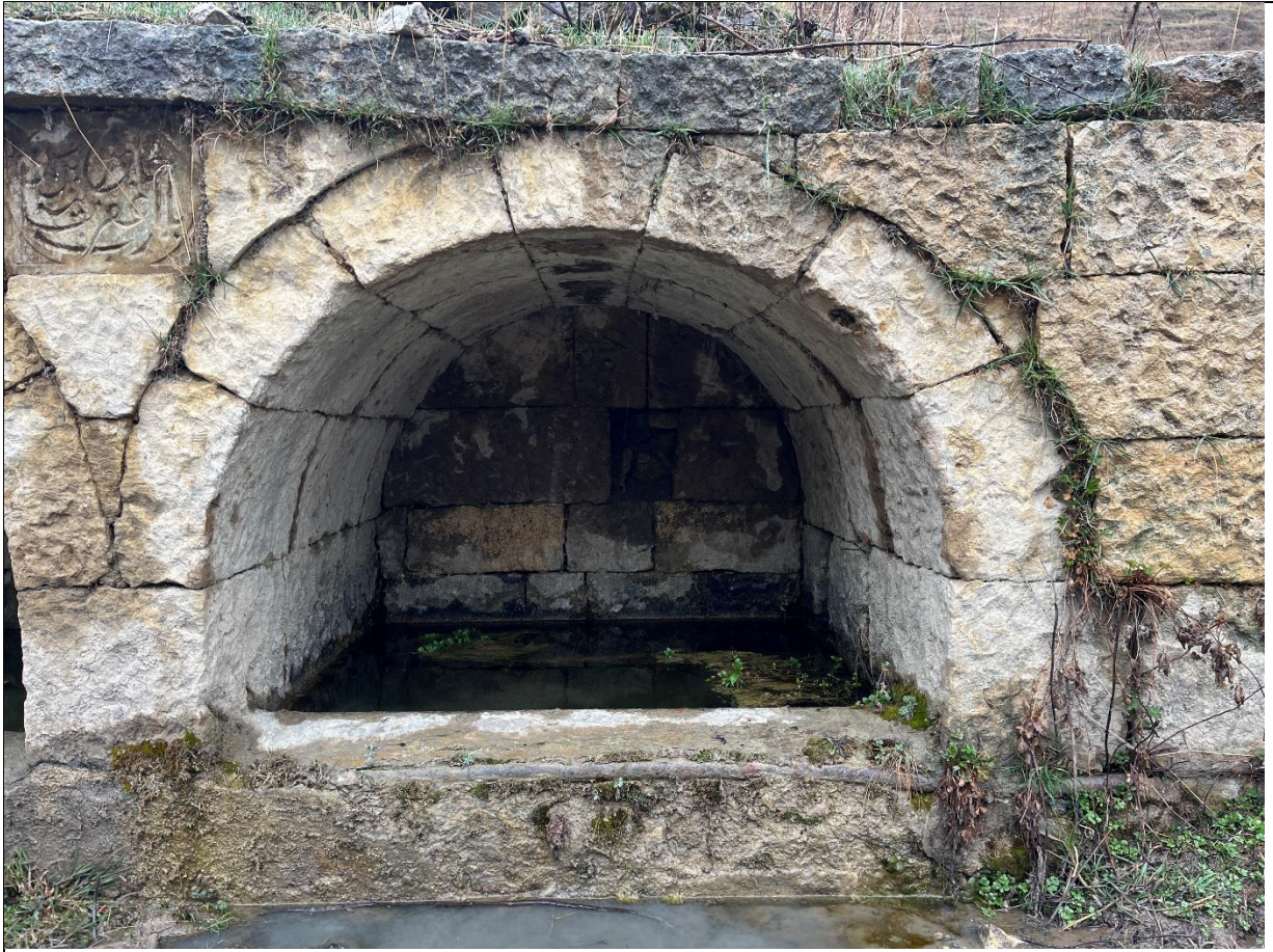
Фото 7. Южный цилиндрический свод источника