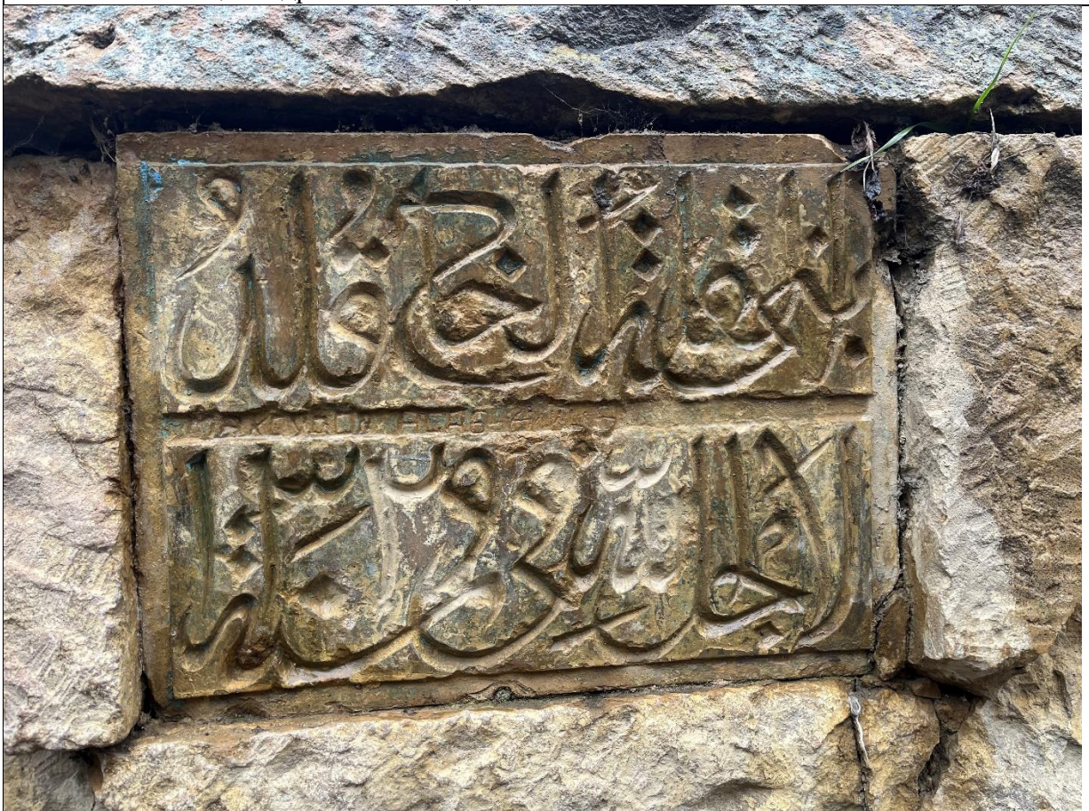
Фото 8. Каменная плита с текстом и датой арабской вязью на пазухе между северным и средним сводами источника