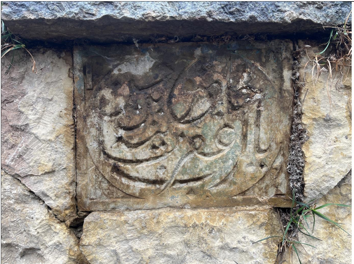
Фото 9. Каменная плита с текстом арабской вязью на пазухе между средним и южным сводами источника