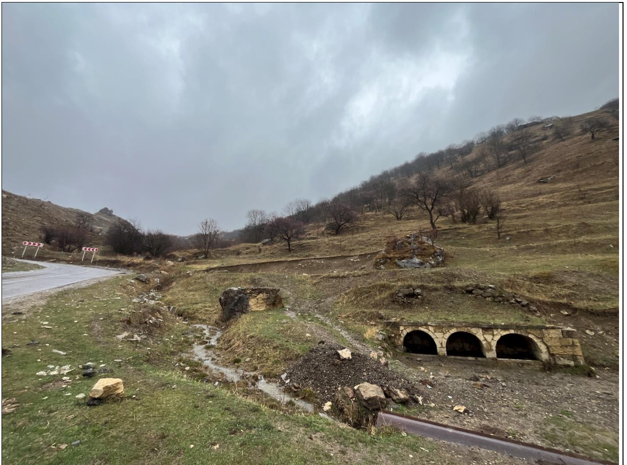
Фото 1. Вид на источник с запада