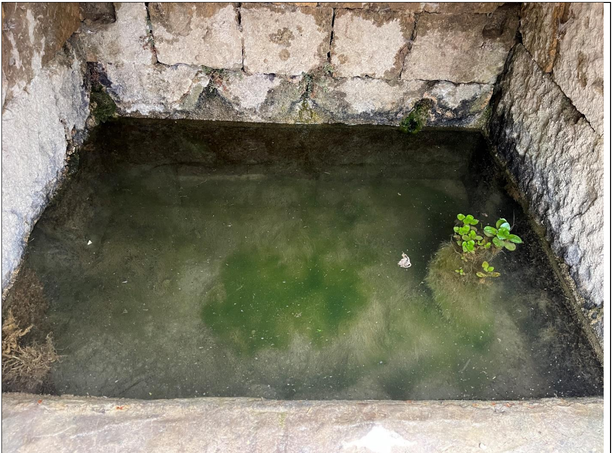
Фото 11. Средняя камера источника