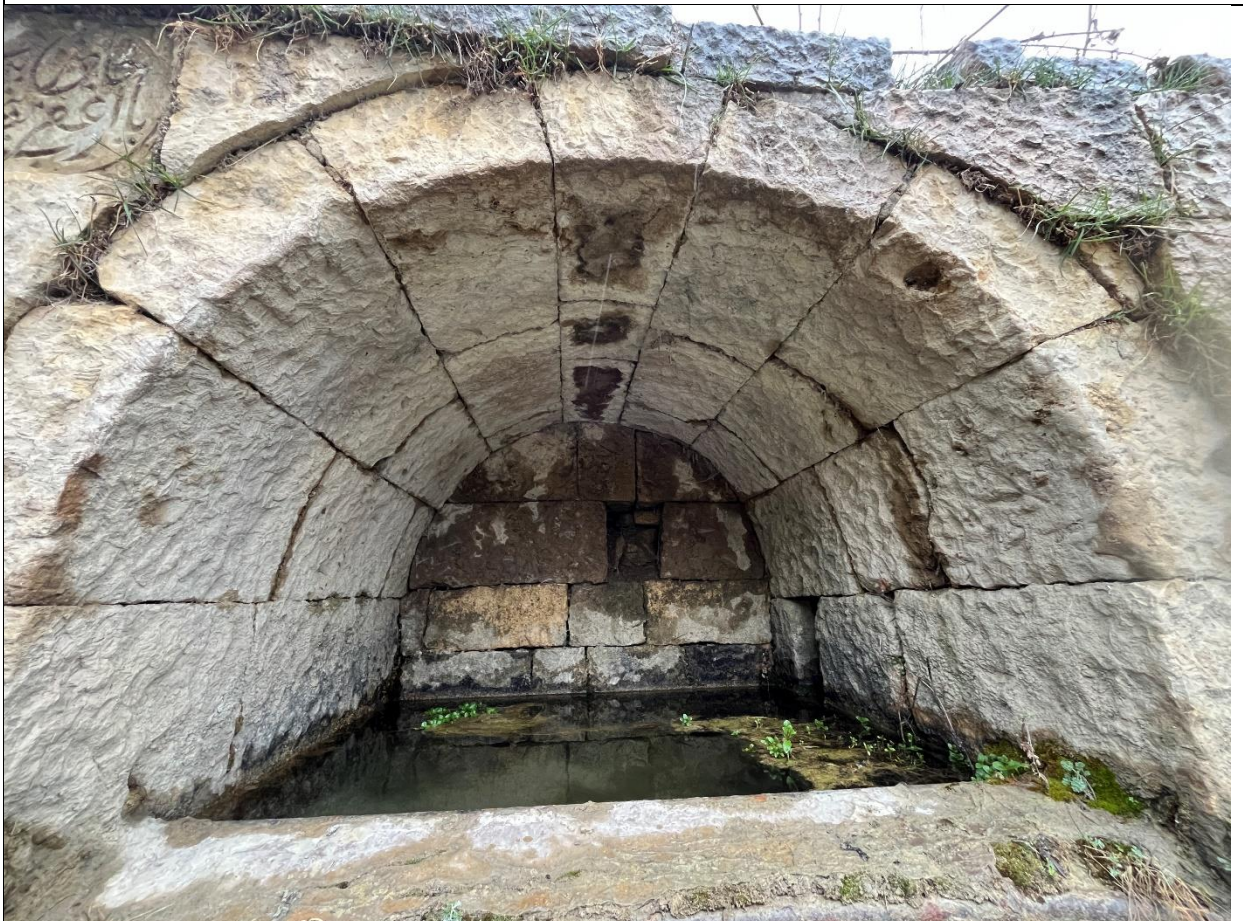
Фото 15. Внутренняя поверхность свода южной камеры источника