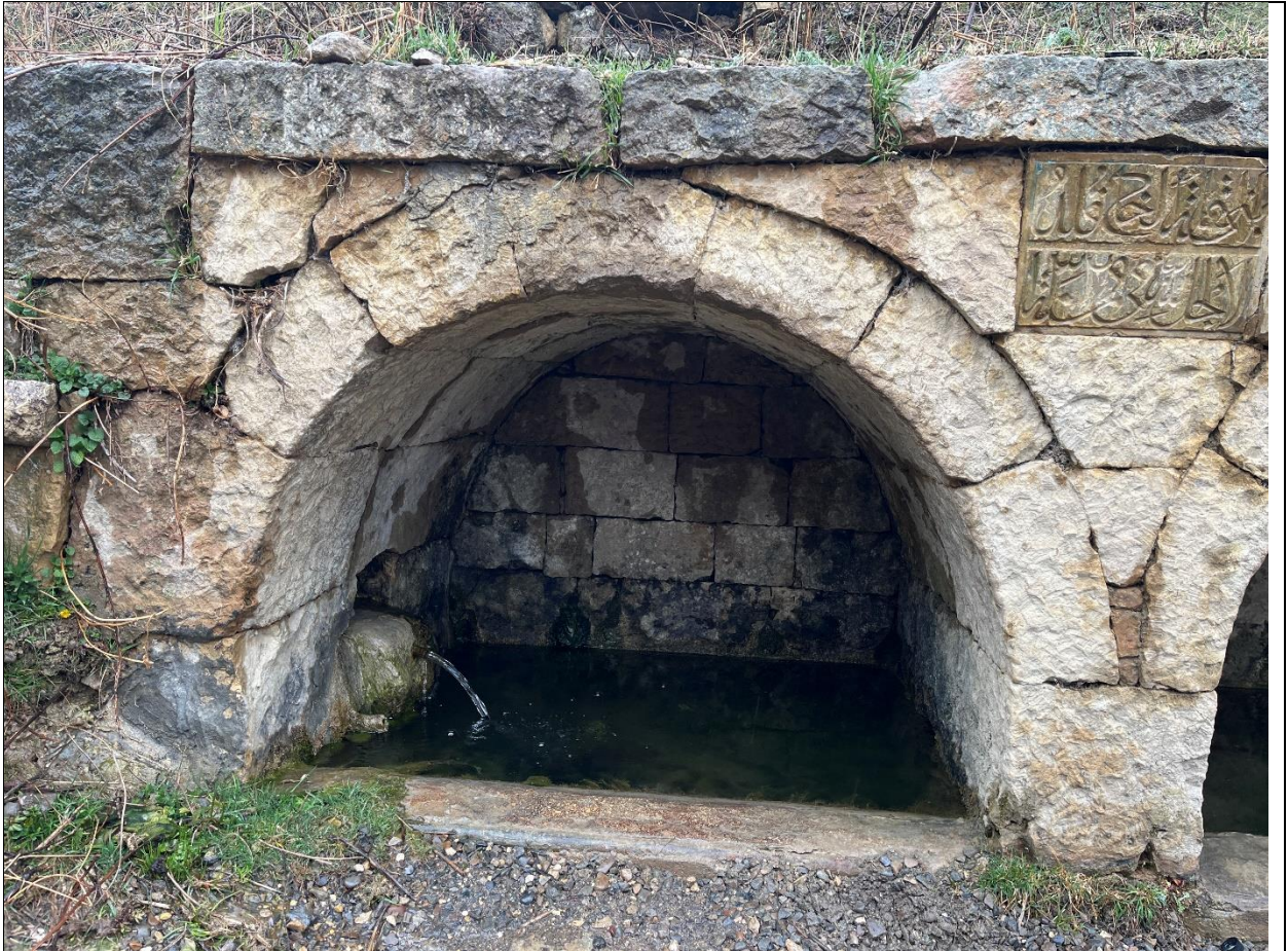
Фото 5. Северный цилиндрический свод источника