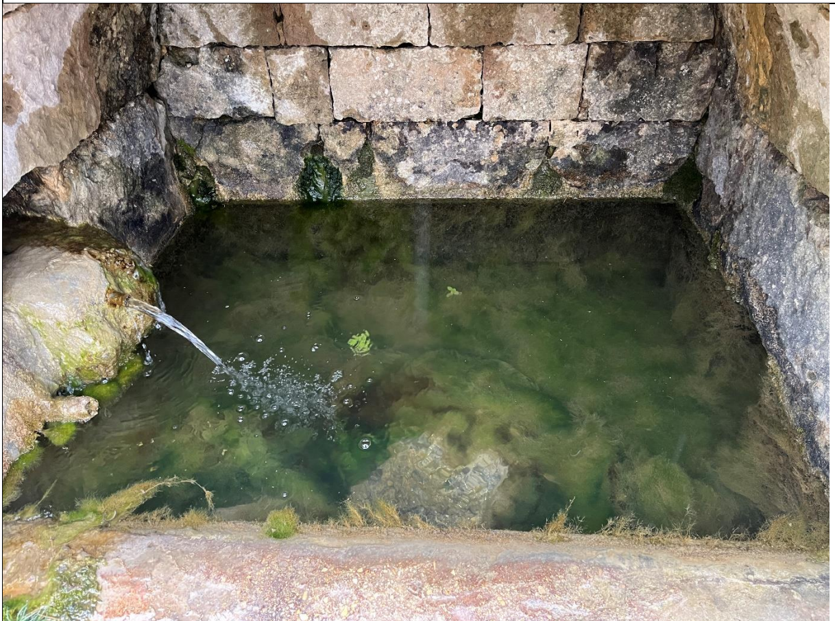
Фото 10. Северная камера источника