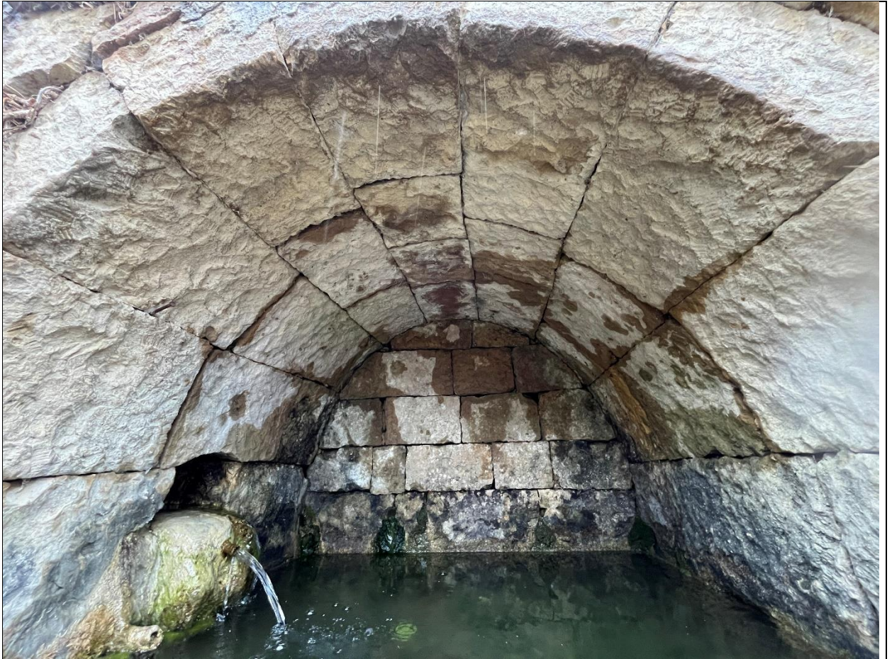
Фото 13. Внутренняя поверхность свода северной камеры источника