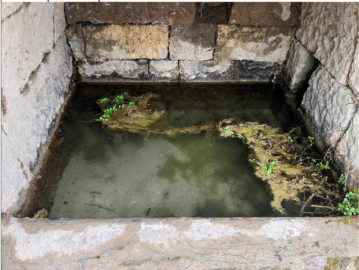
Фото 12. Южная камера источника