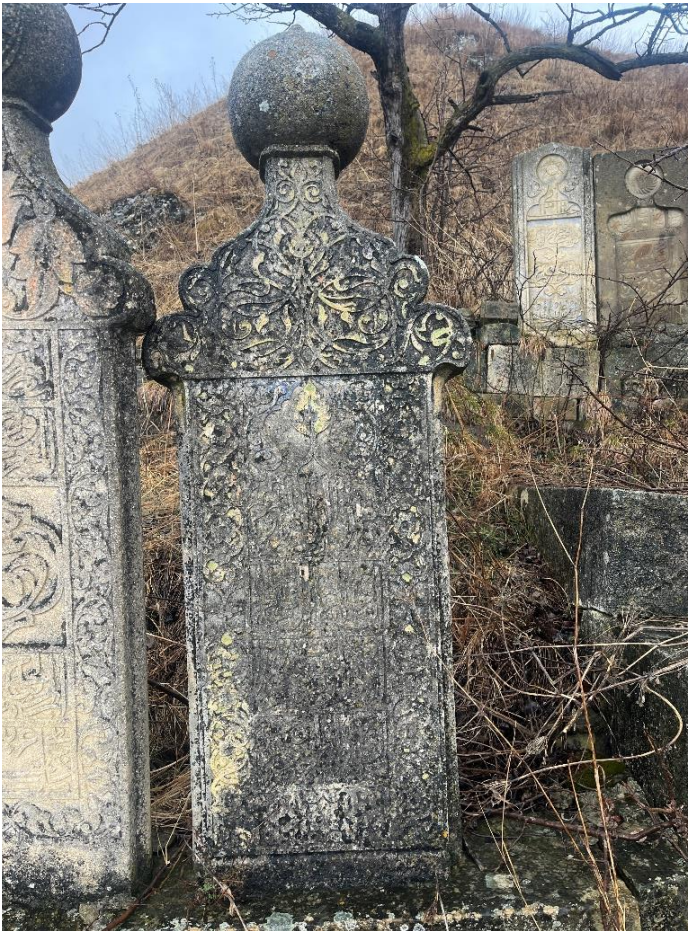
Фото 2. Вид с востока