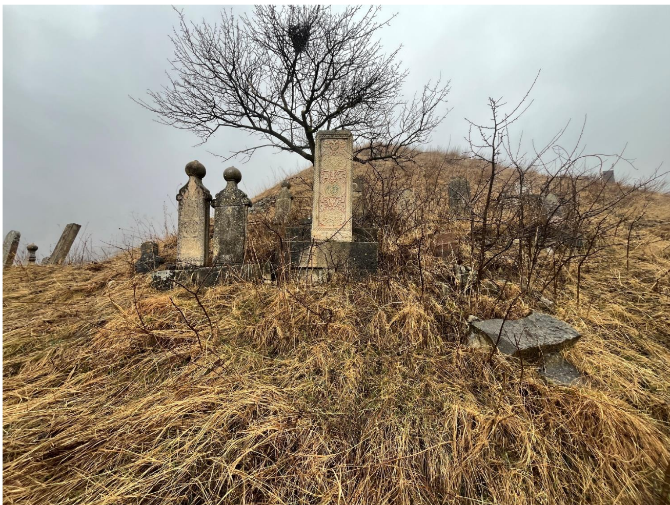
Фото 1. Общий вид Объекта в структуре кладбища