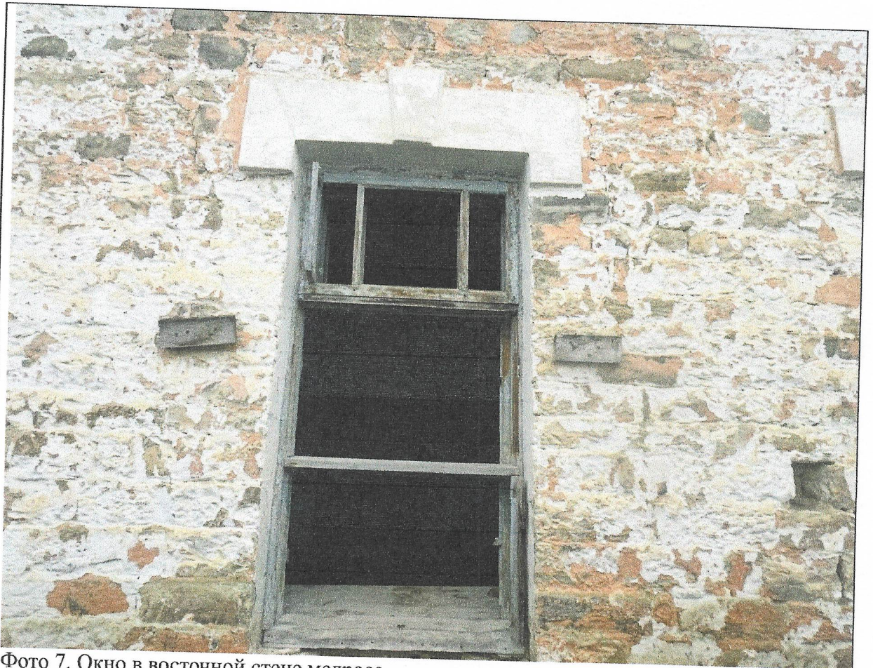
Фото 7. Окно в восточной стене медресе