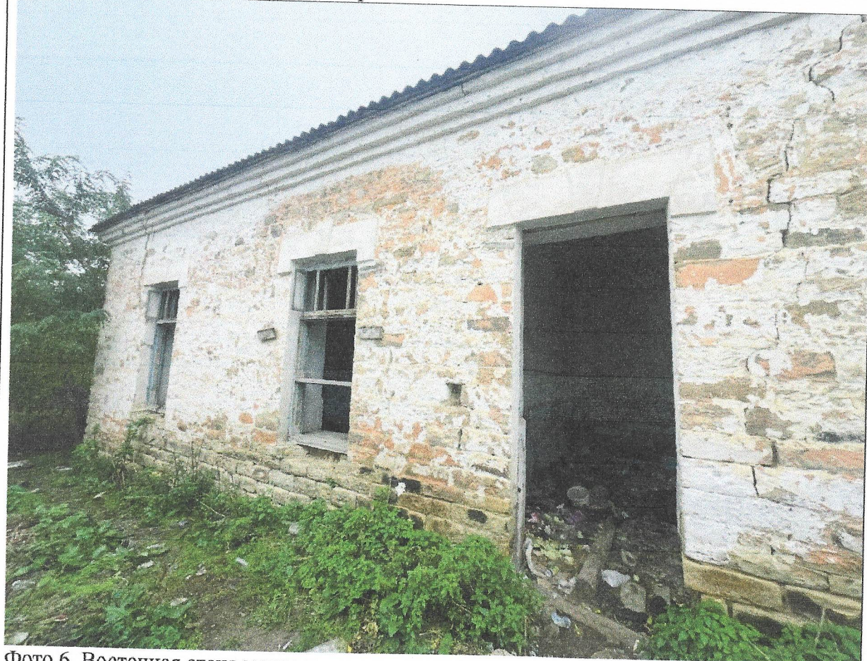
Фото 6. Восточная стена медресе