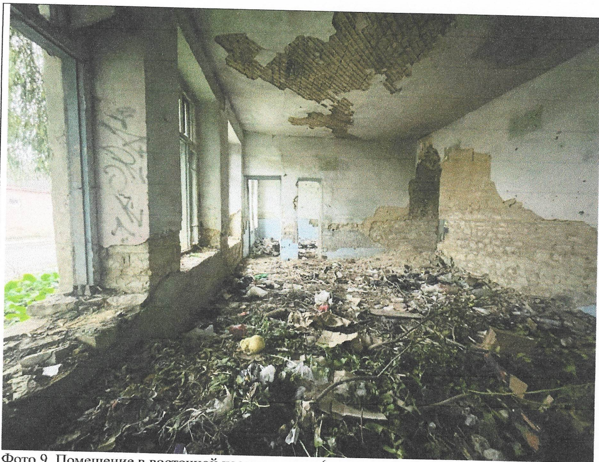
Фото 9. Помещение в восточной части медресе (между коридором и крайним восточным помещением)