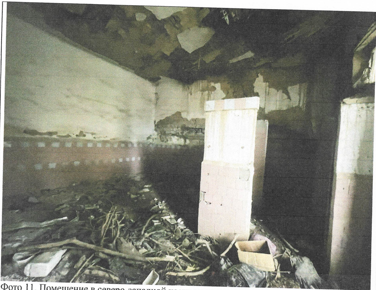
Фото 11. Помещение в северо-западной части медресе