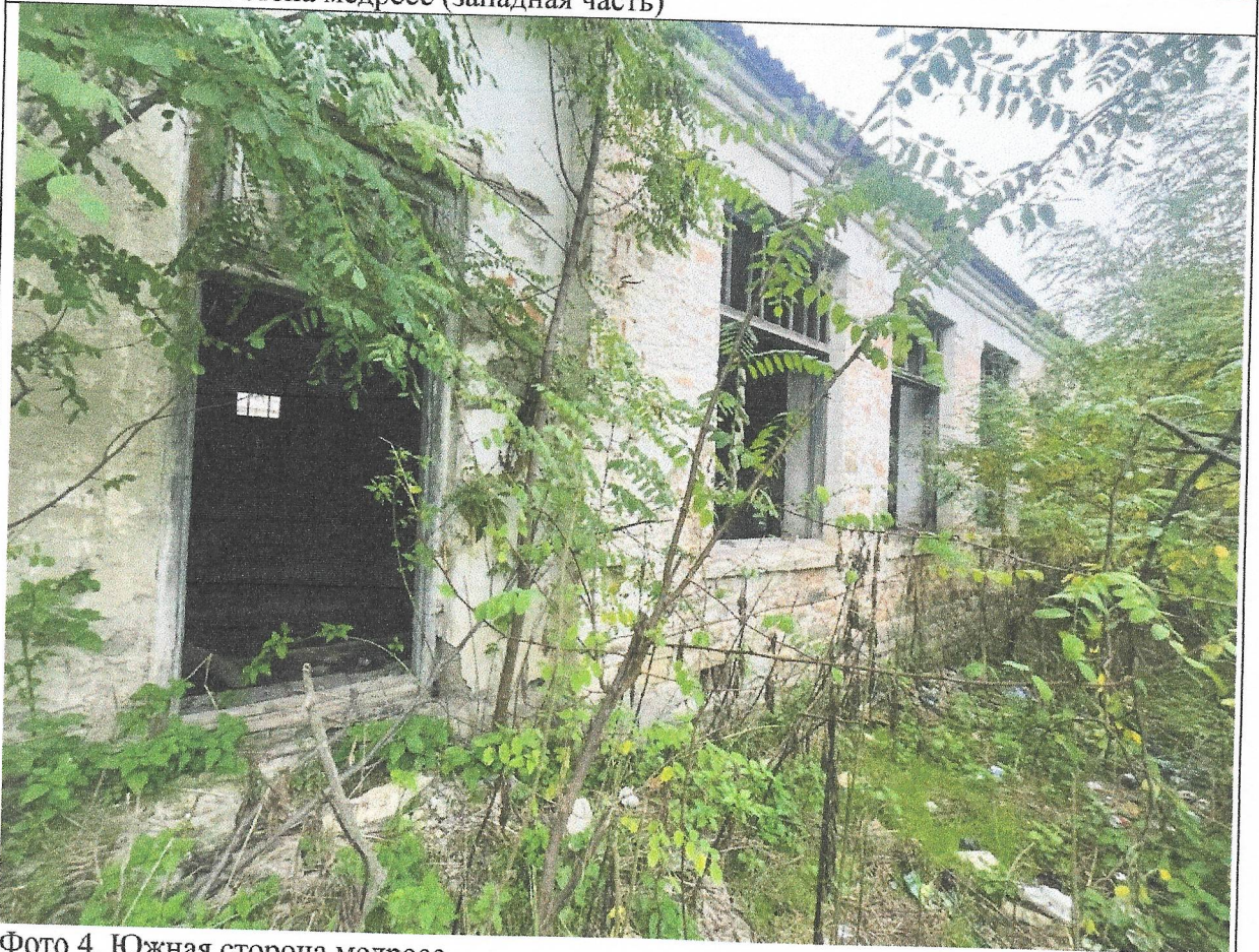
Фото 4. Южная сторона медресе