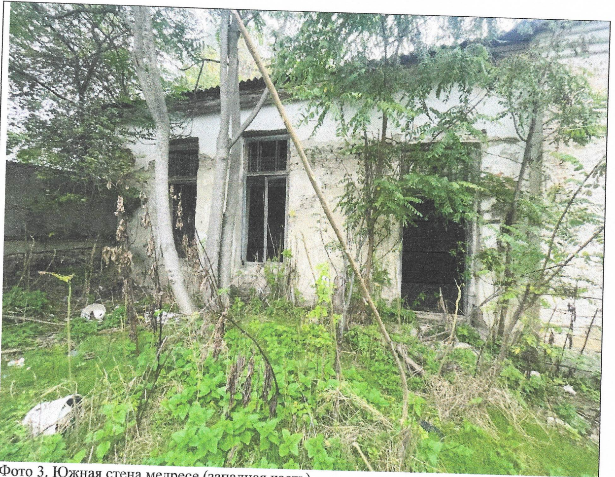
Фото 3. Южная стена медресе (западная часть)