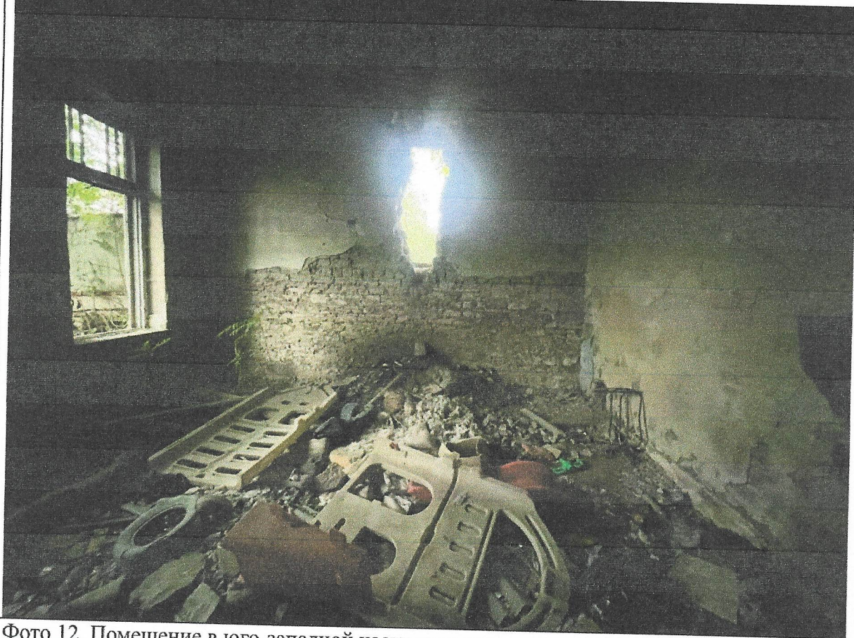
Фото 12. Помещение в юго-западной части медресе