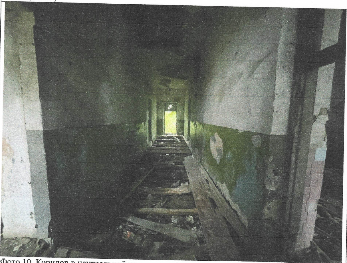
Фото 10. Коридор в центральной части медресе