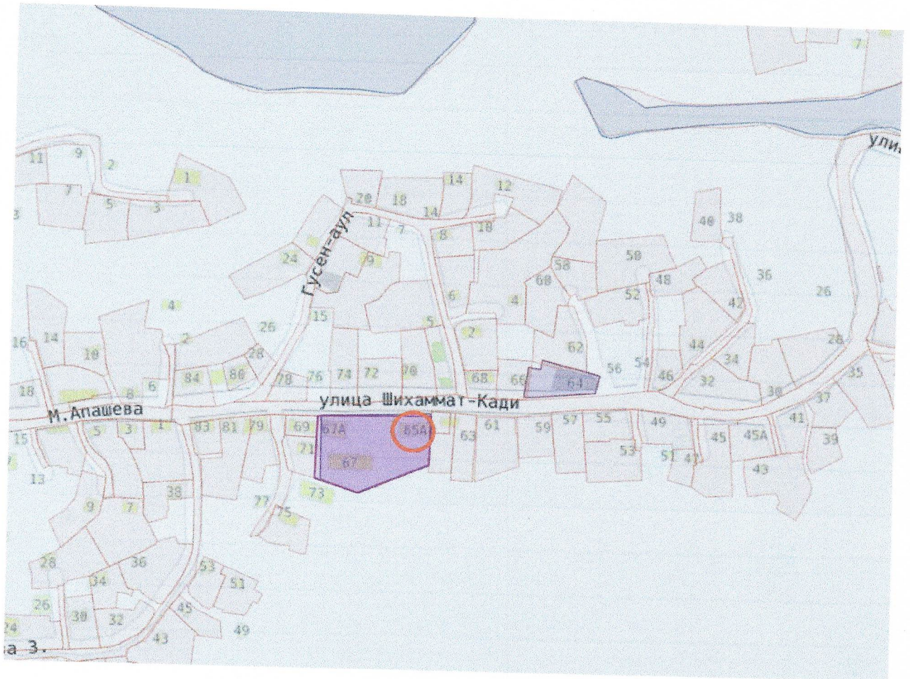
Фрагмент публичной кадастровой карты ( https://nspd.gov.ru ). Местоположение исследуемого объекта выделено красным кругом