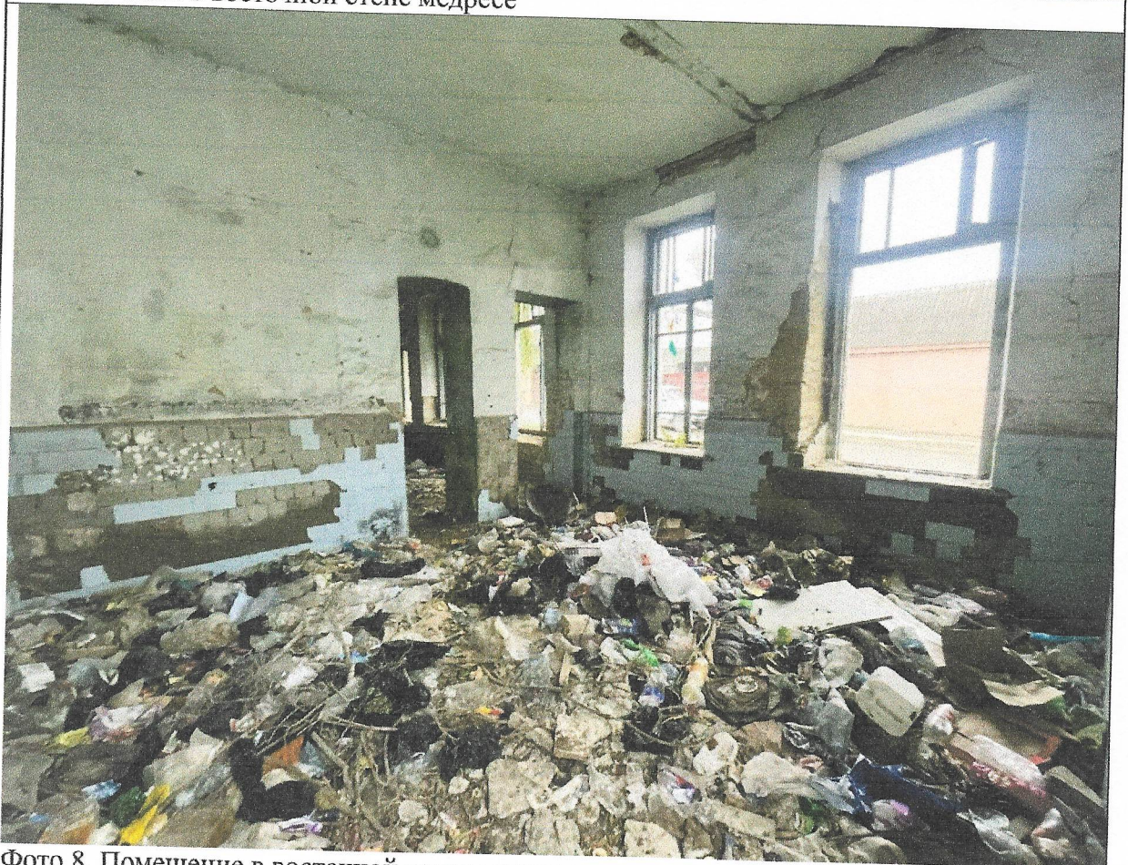
Фото 8. Помещение в восточной части медресе