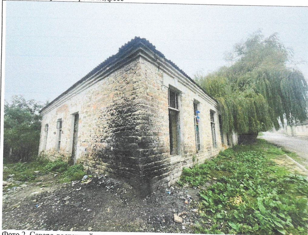
Фото 2. Северо-восточный угол медресе