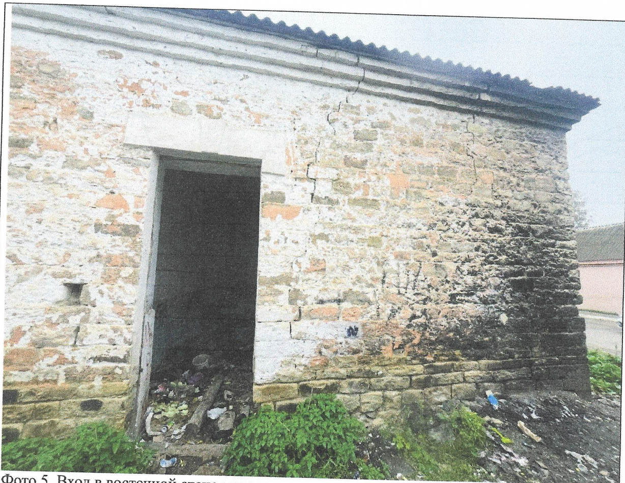
Фото 5. Вход в восточной стене медресе