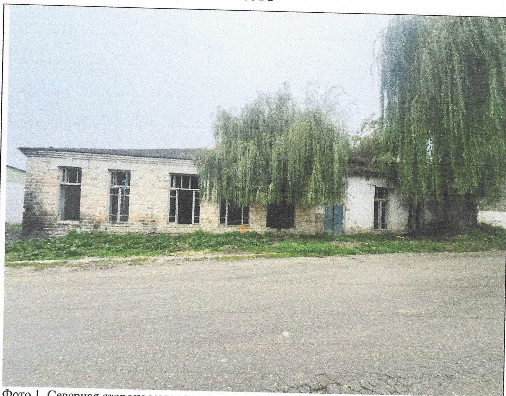
Фото 1. Северная сторона медресе