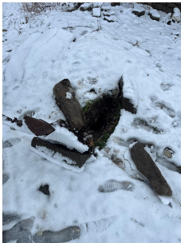
Рис. 3. Фото от 28.03.2026 г. Колодец подземного водопровода вблизи Шамхальского кладбища.