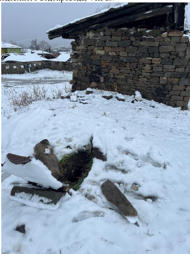
Рис. 2. Фото от 28.03.2026 г. Вид с юга на колодец подземного водопровода вблизи Шамхальского кладбища.