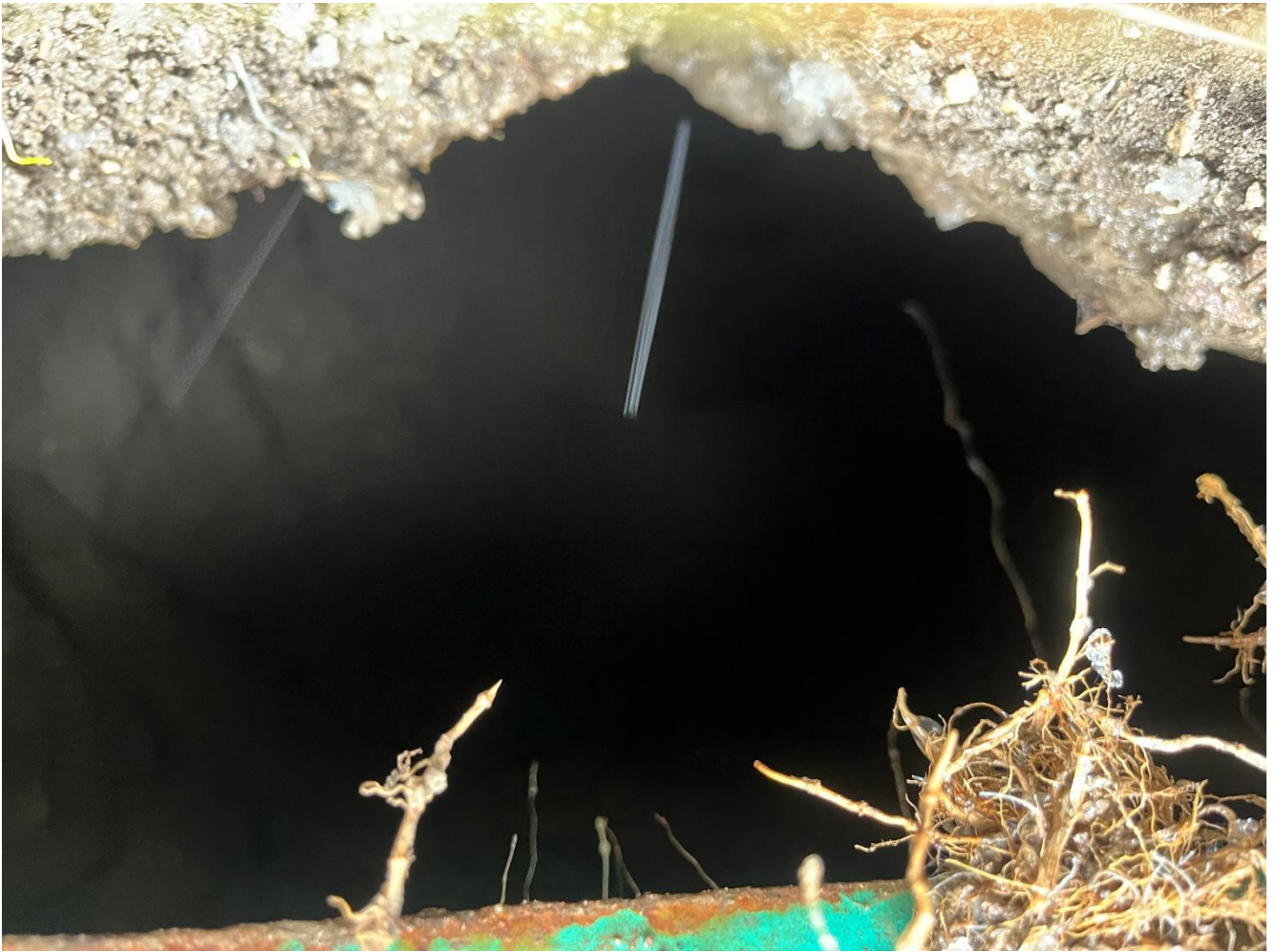
Рис. 4. Фото от 28.03.2026 г. Один из колодцев подземного водопровода вблизи Шамхальского кладбища.

11. Перечень документов и материалов, собранных и полученных при проведении экспертизы, а также использованной для нее специальной, технической и справочной литературы (при значительном количестве документов и литературы их перечень приводится в приложении с соответствующим примечанием в тексте заключения):